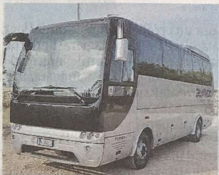
L'AUTOBUS CHE CONDUCE AL MARE

ISPICA. Ha ripreso regolare servizio ieri il servizio di trasporto dalla città di Ispica alla zona balneare di Santa Maria del Focallo e Marina Marza. Il servizio sarà attivo fino al prossimo 9 settembre. Il capolinea parte da via Duca degli Abruzzi e dopo una fermata al cimitero cittadino, si dirige sul litorale fermandosi a al Soda Beach. Prosegue poi sulla litoranea facendo fermate al Borgo Rio Favare, al villaggio Marispica, al viale Kennedy. Prosegue poi per Marina Marza con fermate all'incrocio di via Ucca Marina, Capo Sud, Punta Cirica, Porto Ulisse, sp.67 Bufali-Marza, via Ucca Marina angolo via Malva, dove fa capolinea, per poi tornare indietro verso la città di Ispica. Il consiglio comunale di Ispica aveva approvato lo scorso 18 luglio, la proposta della giunta di affidare in via straordinaria e sperimentale a privati il servizio. "Ri-