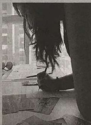
L'ADESIONE DI UNA CANDIDATA

Finirà domani a Marina di Modica la prima fase del concorso estivo "Miss Contea 2018" che vedrà la serata finale il 19 agosto in piazza Matteotti, con il patrocinio del Comune di Modica e la collaborazione di tanti sponsor tecnici e non, oltre ai media partner locali.