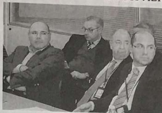
LA RIUNIONE. Numerosa la partecipazione dei rappresentanti delle forze economiche e sociali del territorio: da Confindustria a Cna, da Ance all'Associazione artigiana, all'Adoc. E ancora, Adiconsum, Federalberghi, Coltivatori Diretti, Fabi, Copagri, Confesercenti, Unicoop, Movimento difesa del cittadino, Lega consumatori, Federconsumatori, Confagricoltura, Cgil, Cisl, Uil e Unsic