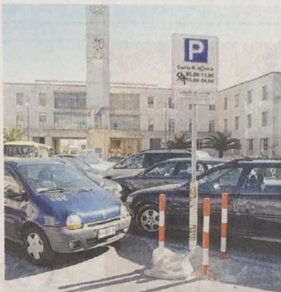
STRISCE BLU IN PIAZZA LIBERTÀ

Cinque milioni di euro. E' l'importo per la gestione del servizio in tre anni. Offerte entro il 25