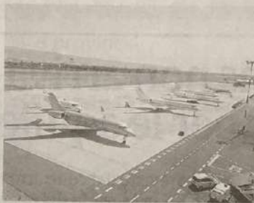
A Comiso si attende la nomina del nuovo ad della Soaco

Comiso. Ancora pochi giorni di incertezze per Soaco spa. Venerdì 20 gennaio è fissata la nuova assemblea dei soci: per quella data la società che gestisce l'aeroporto Pio La Torre avrà un nuovo management. Si dovrebbe chiudere, quindi, tra poco più di una settimana la lunga e travagliata fase di proroghe che ha visto i due soci di Soaco, il comune di Comiso e Intersac, riunirsi a più riprese nel corso del 2016, senza tuttavia arrivare a una quadratura del cerchio sui nomi che avrebbero dovuto già dalla scorsa primavera, e che dovranno a partire dai prossimi mesi, guidare la società di gestione dello scalo ibleo. Solo il sindaco Filippo Spataro, nell'ultima riunione, a fine anno, era riuscito a dare indicazioni circa la quota spettante all'ente casmense. Il primo cit-