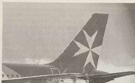
L'AIRBUS AIRMALTA COLLEGERÀ COMISO ALL'ISOLA DEI CAVALIERI