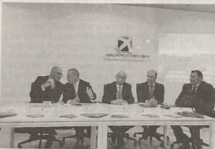
LA PRESENTAZIONE DELLA NUOVA TRATTA