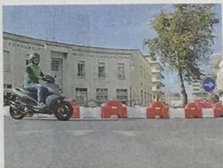
I LAVORI IN PIAZZA LIBERTÀ