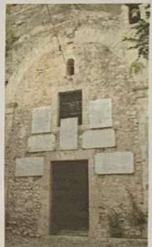
La chiesa di S. Maria della Cava