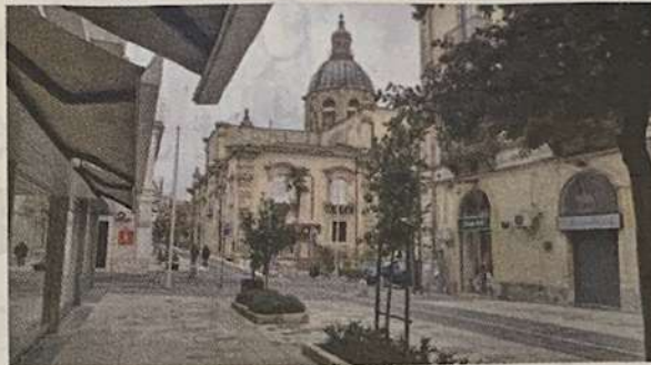
Uno scorcio del centro storico superiore della città

L'attuale amministrazione ha fatto qualcosa (esenzione per tre anni dei tributi comunali ai cittadini che ristrutturano casa in centro storico e vi trasferiranno la residenza n.d.r.) ma è chiaro che non basta per far muovere una famiglia. Ci vorrebbe ben altro, soprattutto indirizzato a chi vuole fare attività commerciale