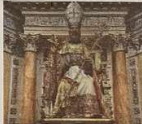
Il simulacro di San Biagio

è esposto il Santissimo Sacramento per il «quarantore». Al termine di quest'adorazione, per tre volte s'intona il salmo «tremò la terra davanti al Signore, al Dio di Giacobbe», mentre l'organo emette un suono stridulo che simula il terremoto. Poi, la statua di San Biagio è portata in processione per il centro storico comisano per far ritorno infine nella chiesa dedicata allo stesso Patrono. Per l'occasione non manca il canto del «Te Deum» di ringraziamento. Infatti, i comisani attribuiscono alla protezione di San