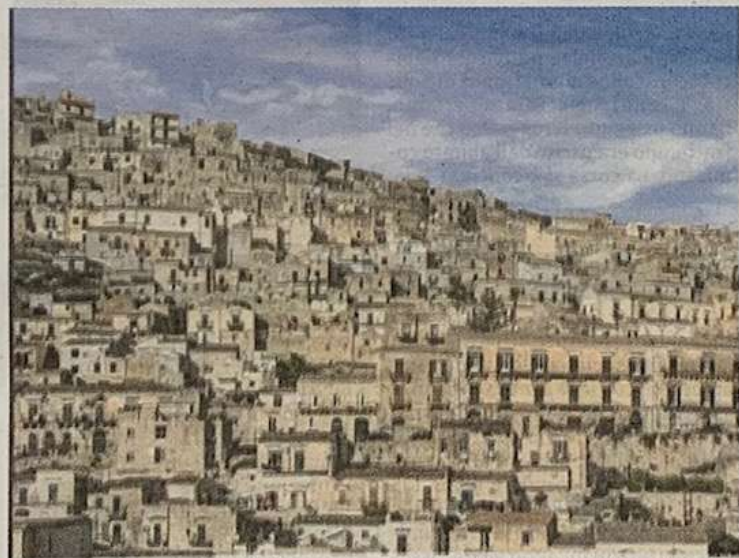
Una panoramica della città e, sopra, le costruzioni sulla collina dell'Itria

"Noi, in modo fattivo - conclude il consigliere pentastellato - faremo la nostra parte per sollecitare e far nascere una riflessione sul territorio che porti alla sua normazione funzionale a creare, in maniera organica, ricchezza e sviluppo".