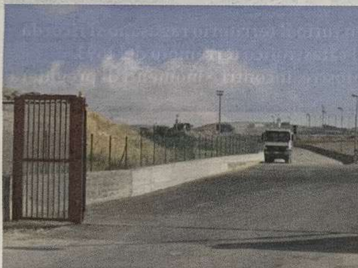
L'ingresso della discarica di Cava dei modicani. Sopra, il sito